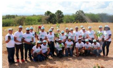
Industrias San Miguel